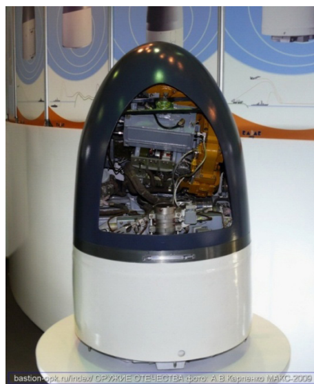
Рис. 2. Система наведения и управления ВТО

Безудержный интерес представляют научно-технические предпосылки дальнейшего развития ВТО. Как известно, для успешного функционирования ВТО необходима информация о местонахождении и состоянии цели, наводимого на нее управляемого средства поражения (УСП) и информация о внешних условиях. В общем случае источником информации для наведения ВТО служит информация об объектах, отображаемая от цели, либо нарушение однородностей каких-либо из физических полей (искусственных или естественных): электромагнитного, гравитационного, акустического, магнитного, эквипотенциального поля рельефа и др. [3].